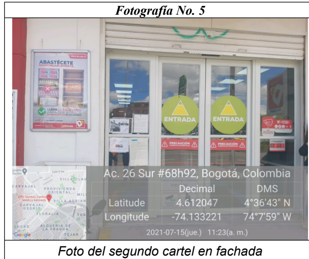
Foto del segundo cartel en fachada